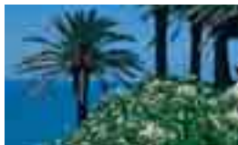
호리키리토게 고개(자동차로 10분)