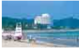
아오시마 해변/수상 스포츠