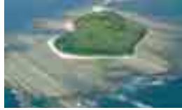
아오시마 섬/아오시마 신사(도보로 10분)